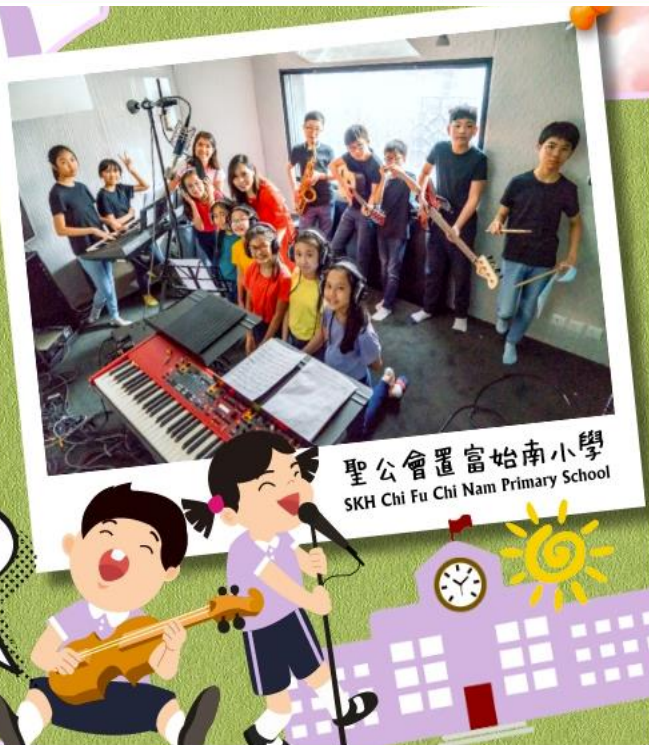
聖公會置富始南小學 SKH Chi Fu Chi Nam Primary School