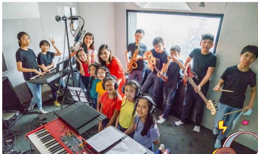
'The Chosen Ones'「置始音韻」今年一同到專業錄音室錄製歌曲《主是一生至寶》以嶄新方式歡然敬拜，為畢業生送上祝福。

蘇校長表示，自己從小在基督教學校和教會長大，在很多優美的詩歌的熏陶下成長，獲益良多，深感好的詩歌力量很大，可以教導、安慰、提醒，幫助人在敬拜中聚焦，更深刻地細味神的話，實在是上帝給我們很大的禮物。適逢學校這兩年的學習主題是「敬神愛人」「勤勉求真」「創藝展能」「尋夢飛行」，致力提升同學的音樂素養、自信表達和創意思維；為突顯聖