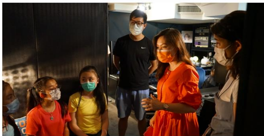
甫抵達錄音室，一眾團員邊細心聆聽蘇校長及老師的安排，邊作最後彩排，為錄音準備。