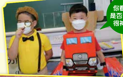
你看我們是否裝扮得很神似！