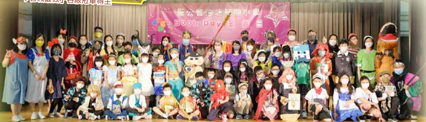
「今日我最似」比賽各班獲獎學生與老師大合照