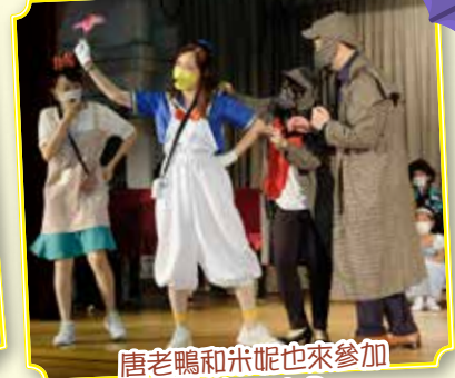
唐老鴨和米妮也來參加我們的Book Day