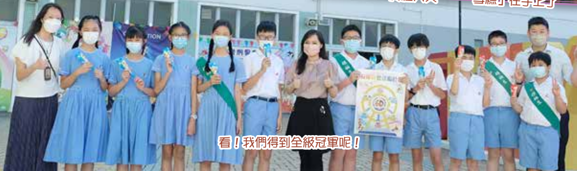
看！我們得到全級冠軍呢！