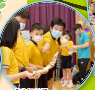
「珠行萬里」需要大家合作才能成功