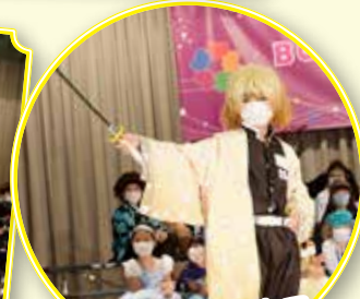
學生在台上演繹自己喜愛的角色！