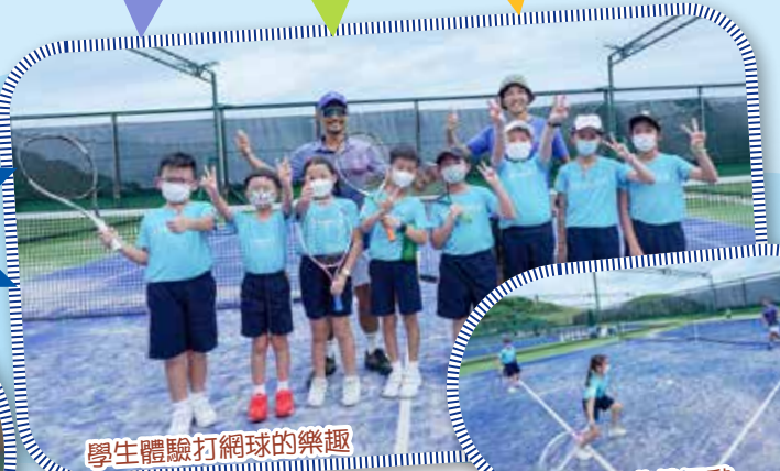
學生體驗打網球的樂趣