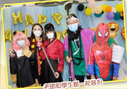
老師和學生都一起裝扮