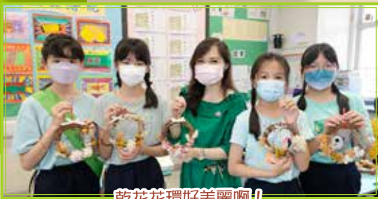
乾花花環好美麗啊!

油塘基顯一向致力推行環境教育，不斷提升學生的環保意識，為環保出一分力。Green Day 活動正正為學生提供了一個深入認識環保概念的機會，讓他們透過遊戲、手工製作、VR 歷程及相關講座等，進一步實踐環保。活動內容豐富有趣，學生在愉快的氛圍中，更有效地認識和實踐環保。