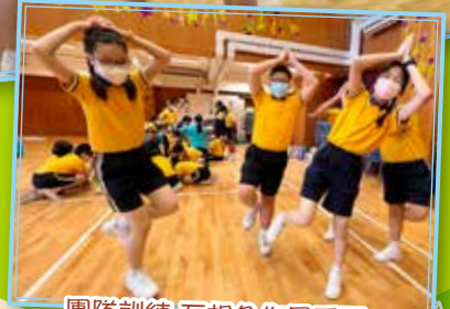
團隊訓練 互相合作最重要