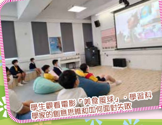
學生觀看電影「美食風球」，學習科學家的創意思維和如何面對失敗