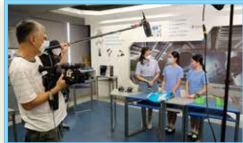
利用超聲波感應器和蜂鳴器提示身邊的人保持社交距離