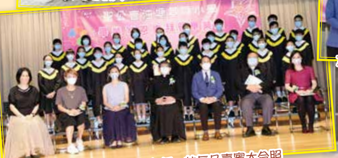
全班同學整齊齊與班主任、校長及嘉賓大合照