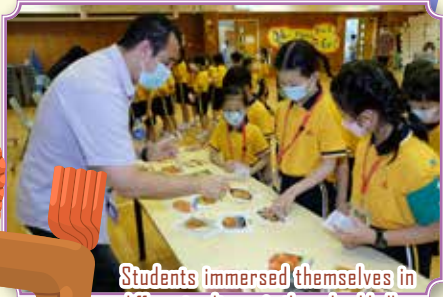
Students immersed themselves in different cultures in the school hall