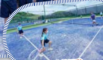
教練透過遊戲活動，讓學生掌握網球比賽的規則