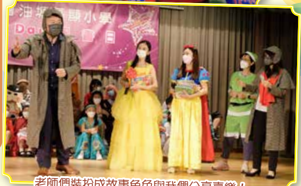
老師們裝扮成故事角色與我們分享喜樂！