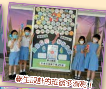
學生設計的班徽多漂亮!