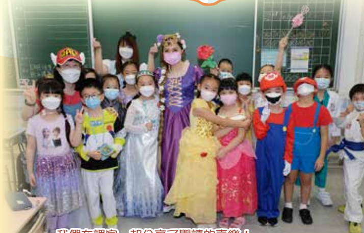
我們在課室一起分享閱讀的喜樂！