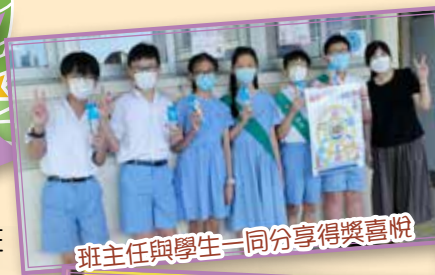
班主任與學生一同分享得獎喜悅

訓育組推行「自律自愛獎勵計劃」，活動內容包括班徽設計比賽，讓學生為自己班別設計有代表性的班徽，表達對自己班的期望，並加強學生對自己班的歸屬感。而「自律比賽」由十月開始進行，老師觀察學生平日轉堂和集會表現，以貼紙獎勵表現良好的班別。計劃讓學生提升自律能力之餘，亦創造正面讚賞的學習環境。