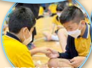
同學們專注研究解開「Magic Ring」

烏溪沙青年領袖及全人發展中心共 28 位活動導師到校為六年級學生進行日營活動，學生透過不同的團隊訓練活動和任務，建立團隊的情誼，彼此相愛，得到力量，迎接中學的新生活。