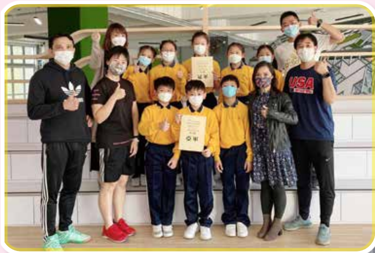
2021-22九龍東區小學校際羽毛球比賽