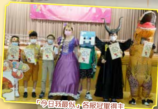
「今日我最似」各級冠軍得主