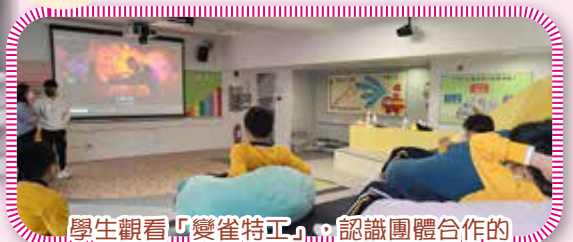
學生觀看「變雀特工」，認識團體合作的重要性，學習同理心和欣賞別人的長處