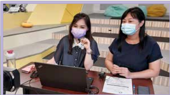
蘇校長和劉主任向友校分享推行「油基同理深度行」的經驗

我們在會上分享油基老師全心全意教育學生的行動，例如訂購動物造型的心意卡、邀請學生為刊物設計動物造型等。在學生為流浪貓狗養殖場勸捐食物前，老師致電請不便捐贈的機構也接聽學生電話，目的是希望學生遇到拒絕仍堅持實踐同理心。