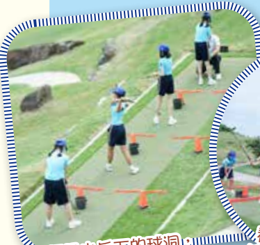
目標是山丘下的球洞，看我怎樣一杆入洞