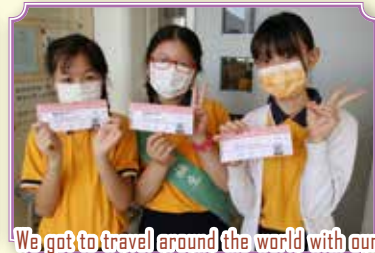
We got to travel around the world with our YKH boarding pass