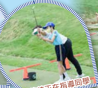
教練正在指導同學揮杆動作