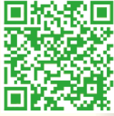
前往聆聽訪問錄音

為配合廿一世紀全球經濟、科學及科技急速的發展，本校以培育學生具備創造、協作和解決問題的能力，並強化學生的綜合和應用知識與技能的能力，以應對全球的轉變和挑戰為目標，推動全校 STEM 教育與編程學習，深化價值觀教育與促進學生綜合運用共通能力，透過有效的學與教策略促進學習。是次訪問介紹了本校 STEM 教育發展策略，學生將編程加入科技產品中，並透過設計思考，從人的需求出發，為各種議題尋求創新解決方案，並創造更多的可能性。