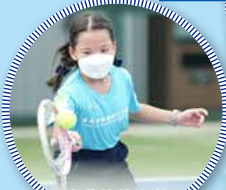
經過專業教練指導，學生開始掌握擊球要訣

油塘基顯一班 Tennis Rocks 的學生，獲香港網球總會邀請到清水灣鄉村俱樂部參加網球及高爾夫球體驗活動。大部分學生都是初次接觸這兩項活動，他們接受專業教練的指導，享受其樂趣。