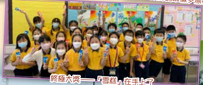
終極大獎——「雪糕」在手上了