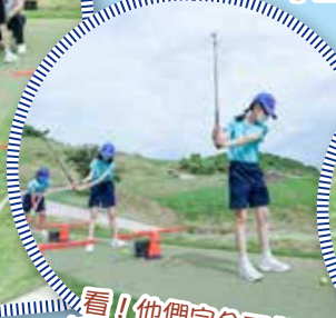
看！他們完全不像第一次接觸高球運動