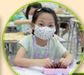
製作環保蚊香十分有趣