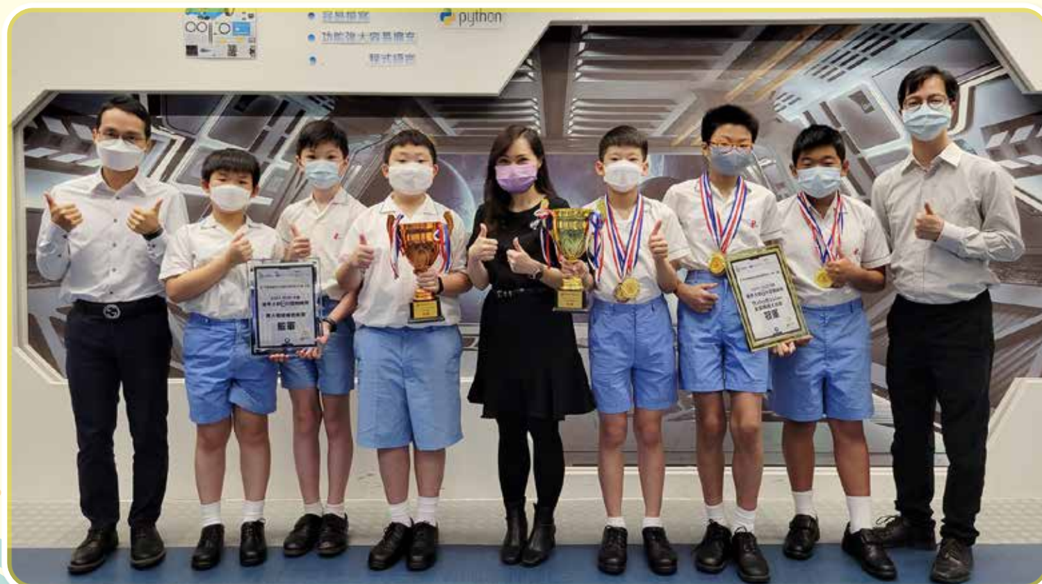
本校參加機甲大師(西貢)分區挑戰賽RoboMaster 能量機關大挑戰 (編程)及無人機穿越障礙賽 (遙控)分別榮獲冠軍及優異獎