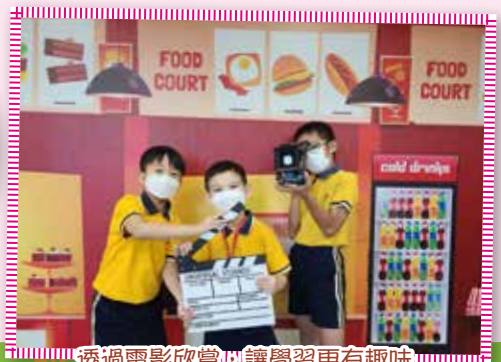
透過電影欣賞，讓學習更有趣味