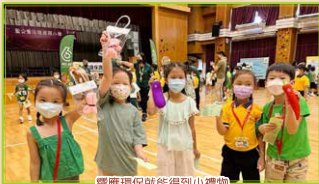
響應環保就能得到小禮物