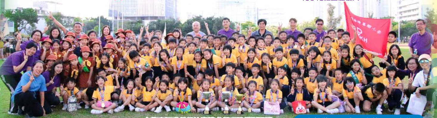
九龍東區遊戲日比賽獲多個項目組別冠軍