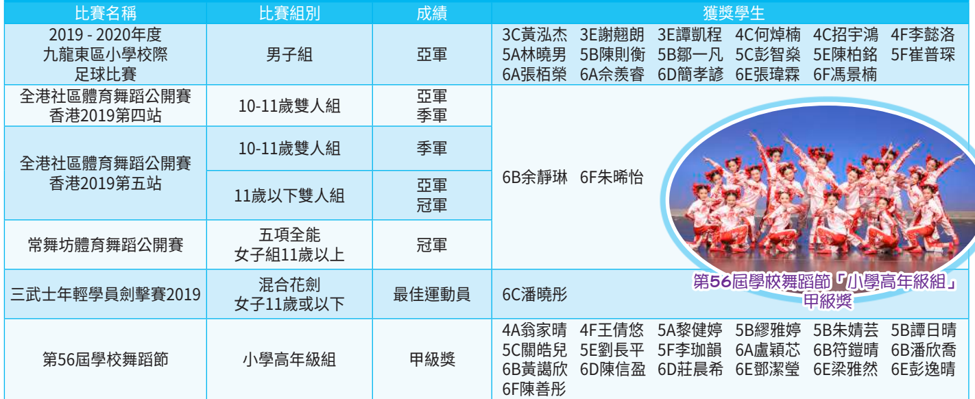
第56屆學校舞蹈節「小學高年級組」 甲級獎