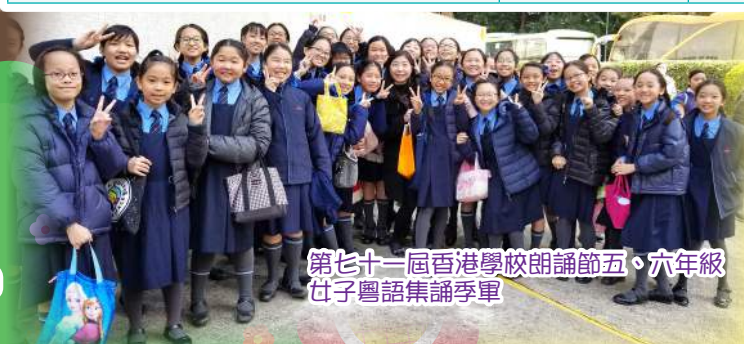
第七十一屆香港學校朗誦節五、六年級女子粵語集誦季軍