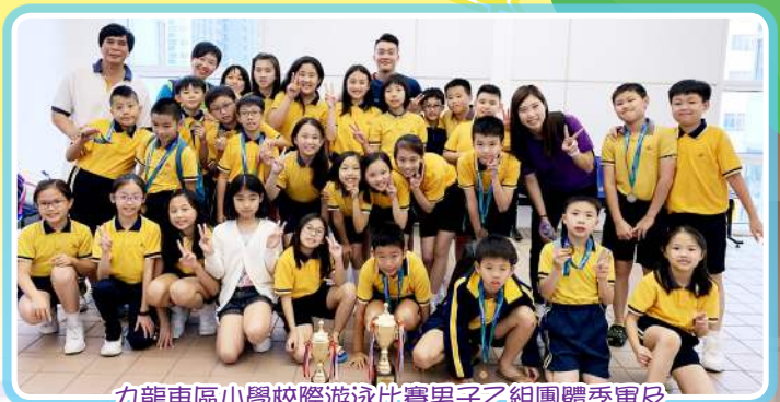
九龍東區小學校際游泳比賽男子乙組團體季軍及 男子丙組團體優異