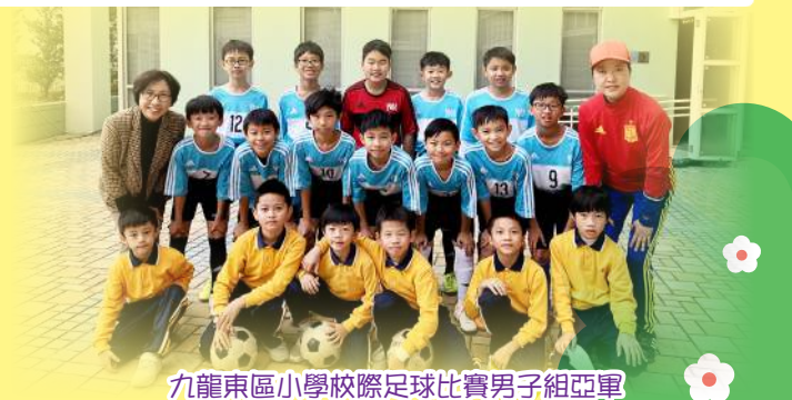
九龍東區小學校際足球比賽男子組亞軍