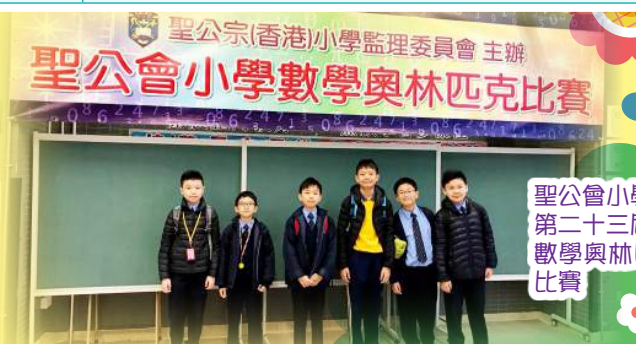
聖公會小學第二十三屆數學奧林匹克比賽