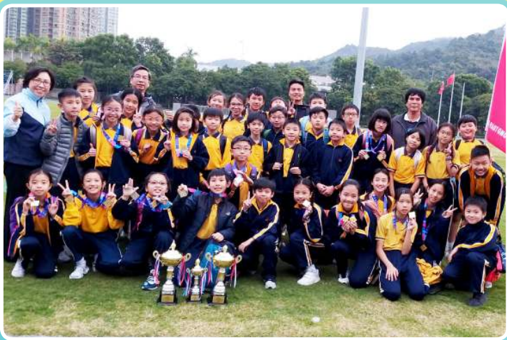
九龍東區小學校際田徑比賽女子甲組及丙組團體冠軍