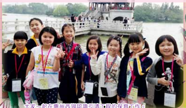
大家一起在惠州西湖認識引清工程的保育工作。