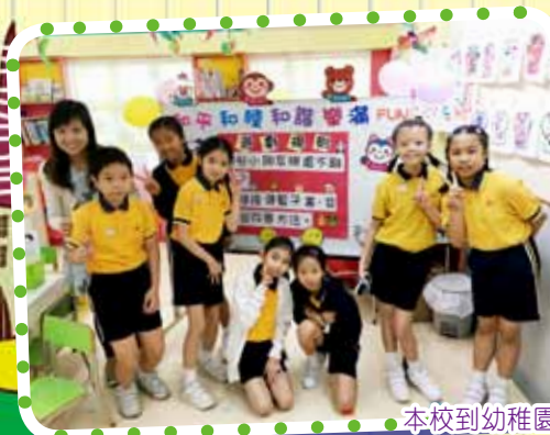
本校到幼稚園設置攤位。