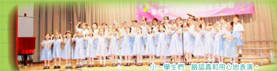
小一學生們一臉認真和用心地表演。