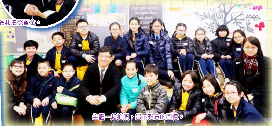
全體一起拍照，留下難忘的回憶。