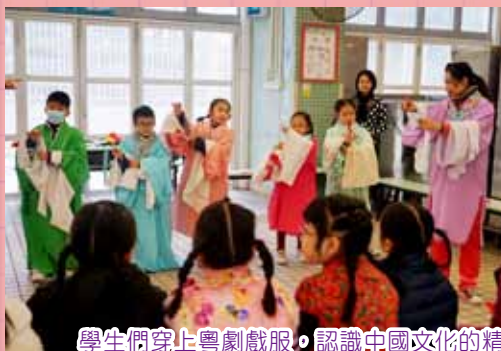
學生們穿上粵劇戲服，認識中國文化的精粹。