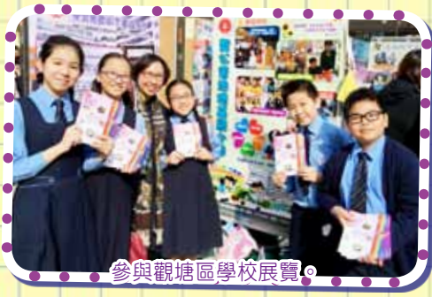
參與觀塘區學校展覽。