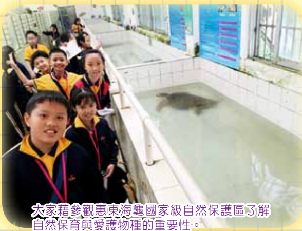
大家藉參觀惠東海龜國家級自然保護區了解自然保育與愛護物種的重要性。

我覺得很開心，因為在惠州科技館中，我學會如何節省能源及保護環境。而在惠州西湖中，我學會蘇東坡的事跡，原來蘇東坡被貶到惠州時，因喜愛吃荔枝，所以說「日啖荔枝三百顆，不辭長作嶺南人」，意思是如果每天吃三百顆荔枝，我願意永遠都作嶺南的人。奸官聽到便告訴皇上。皇上氣憤地說：「你不回來做官，我就不給你吃荔枝！」最後，蘇東坡又再被貶到海南島了。