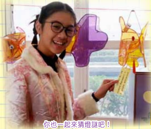
你也一起來猜燈謎吧！