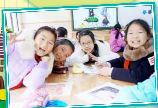
我們和星瀾小學的學生們愉快地交流學習的心得。