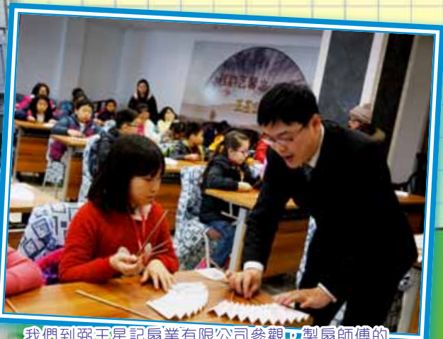
我們到弼王星記扇業有限公司參觀，製扇師傅的手藝令我們眼界大開。