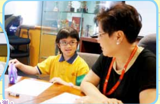
盧教授和勞博士正在與學生們進行前測和後測。