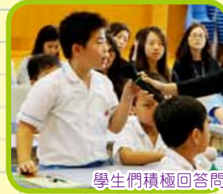
學生們積極回答問題，發表意見。