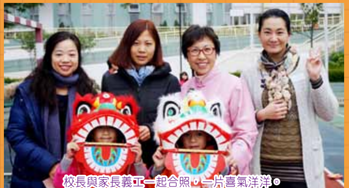
校長與家長義工一起合照，一片喜氣洋洋。

每年農曆新年前夕，本校都會舉辦「文化日」活動，讓學生能寓學習於娛樂，在輕鬆愉快的學習環境中了解中華文化，傳承中華民族的美德。在2月3日，不少師生都穿起傳統中國服回校，校園洋溢着濃厚的中國文化氣息。當天的活動包羅萬有，如粵劇折子戲表演、粵劇面譜介紹、中國雜耍、猜燈謎、賀年掛飾製作、舞獅等等，學生透過充滿趣味及教育意義的攤位，對中國文化傳統和歷史有更深的認識。