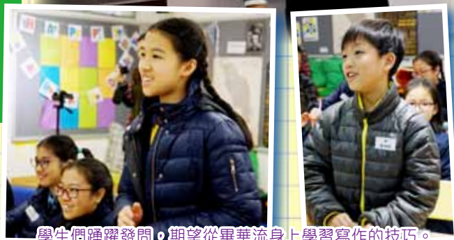
學生們踴躍發問，期望從畢華流身上學習寫作的技巧。