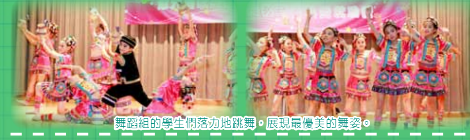
舞蹈組的學生們落地地跳舞，展現最優美的舞姿。