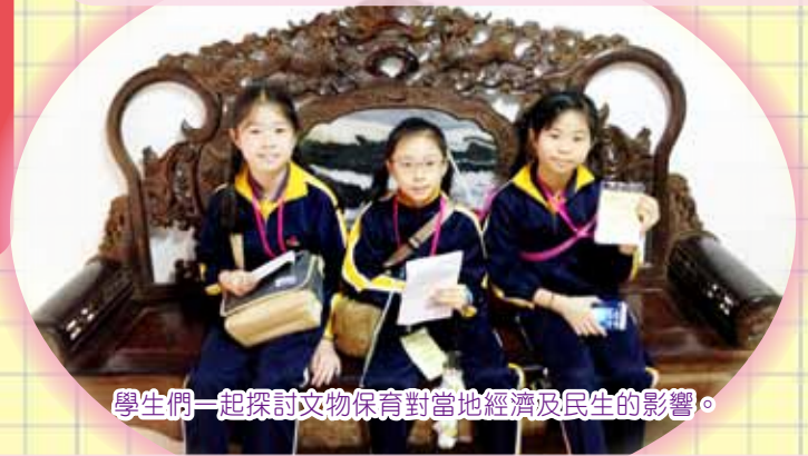
學生們一起探討文物保育對當地經濟及民生的影響。

今天，我參觀了惠州西湖和惠州科技館，認識了惠州西湖的引清工程的保育工作，亦學會了科技的確為人類帶來無限的方便。但如果不正確地使用科技產品，不但不會為我們帶來好處，反而會帶來壞處，例如長期使用電子產品使眼睛受損等。我希望下次也能參加交流活動。