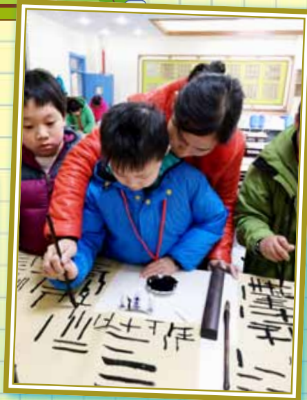
你看！星瀾小學的老師耐心地指導我們練習書法。