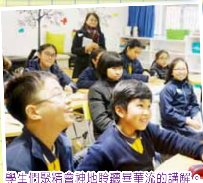
學生們聚精會神地聆聽畢華流的講解。