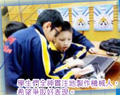
學生們全神貫注地製作機械人，希望爭取好表現。

隨着STEM教育的發展新趨勢，學校亦十分重視科學、科技、數學課程和學習活動。在3月5日，本校的機械人製作隊參加了「第四屆聖公會小學聯校機械人冬季奧運會」比賽。經過一輪緊張激烈的比賽後，本校獲得了短跑項目的殿軍。學生能夠在學習科學知識的同時，亦能獲得獎項，實在使人感到欣喜。我們期望往後能舉辦更多與科學有關的活動，培養學生對工程、電腦編程的興趣，從而啟發和培育他們的科研潛力。