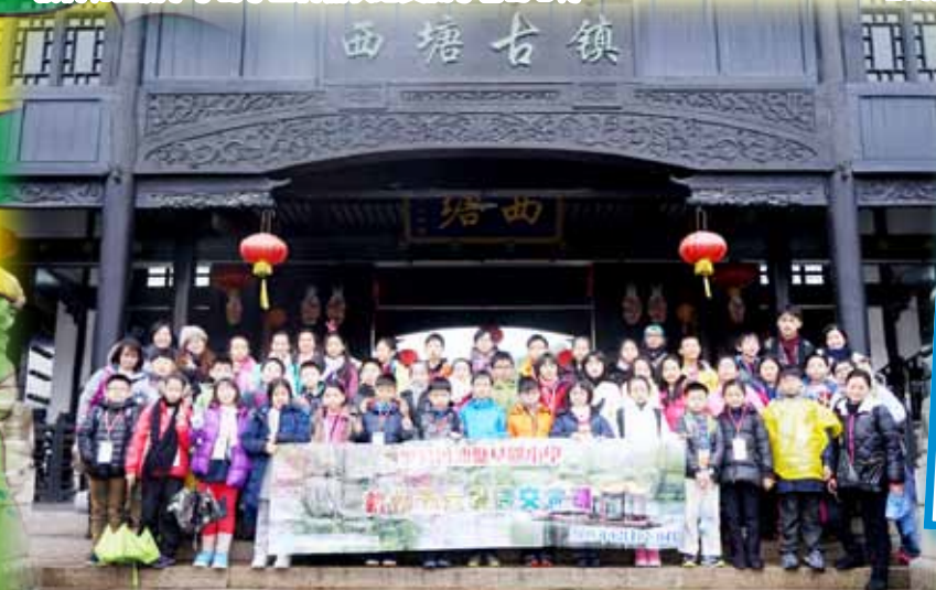
我們到了充滿江南水鄉氣息的西塘古鎮遊覽。