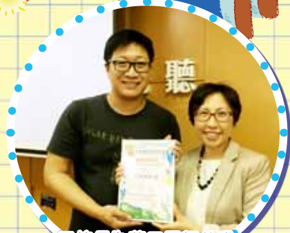
王校長為藍田靈糧幼稚園主持家長講座。