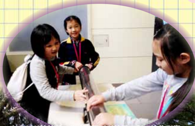
在惠州科技館內，學生們探討科技發展對環境的影響。