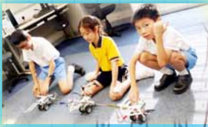
學生們正用心地研究籃球機和機械車的製作方法。

隨着STEM教育的發展新趨勢，學校亦十分重視科學、科技、數學課程和學習活動。在3月5日，本校的機械人製作隊參加了「第四屆聖公會小學聯校機械人冬季奧運會」比賽。經過一輪緊張激烈的比賽後，本校獲得了短跑項目的殿軍。學生能夠在學習科學知識的同時，亦能獲得獎項，實在使人感到欣喜。我們期望往後能舉辦更多與科學有關的活動，培養學生對工程、電腦編程的興趣，從而啟發和培育他們的科研潛力。