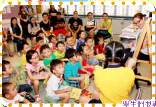
學生們很專心地聆聽故事。