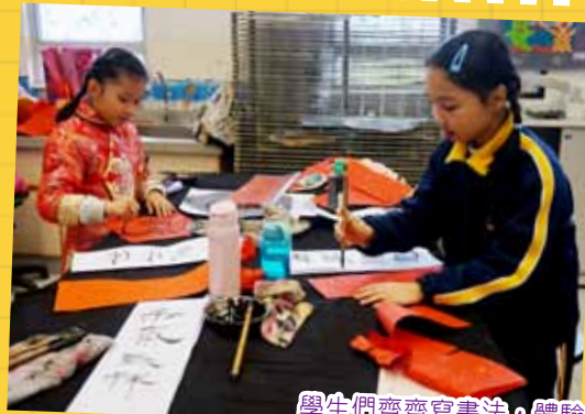
學生們齊齊寫書法，體驗當中的樂趣。