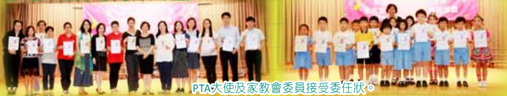
PTA大使及家教會委員接受委任狀。