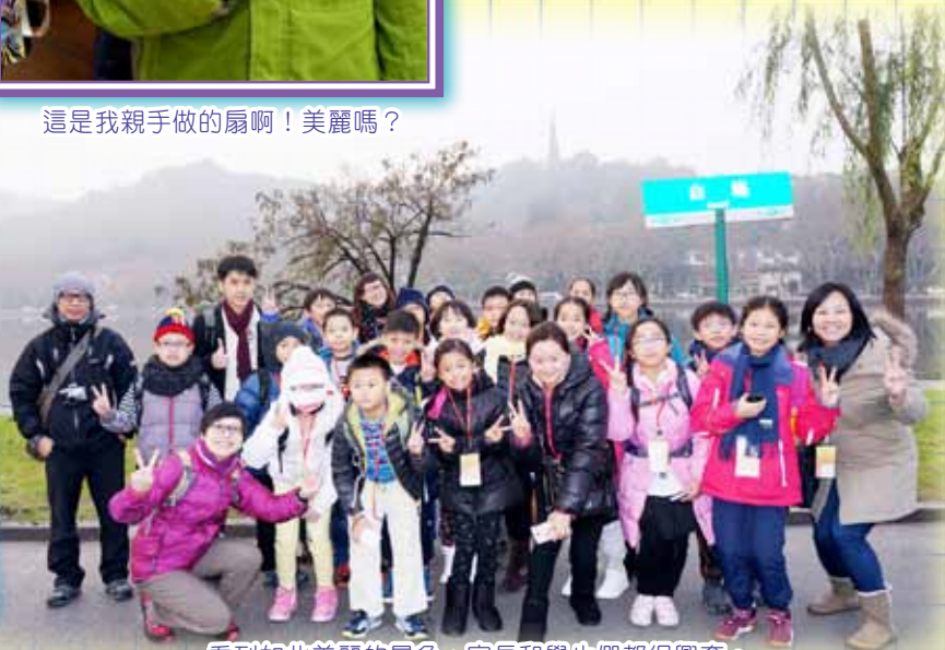
看到如此美麗的景色，家長和學生們都很興奮。