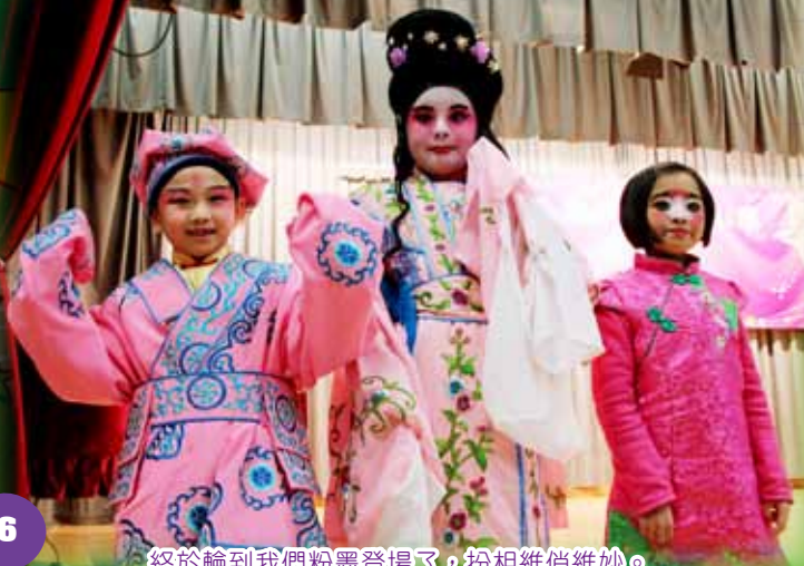
終於輪到我們粉墨登場了，扮相維俏維妙。