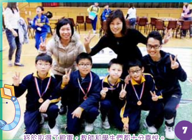
終於取得了殿軍，教師和學生們都十分喜悅。