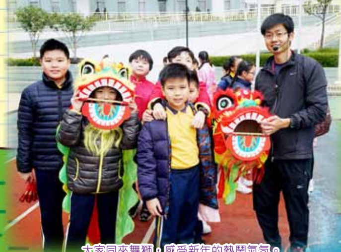
大家同來舞獅，感受新年的熱鬧氣氛。