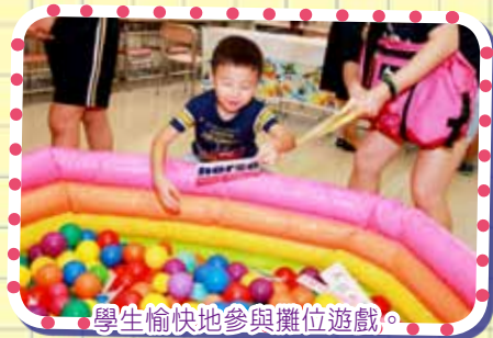
學生愉快地參與攤位遊戲。