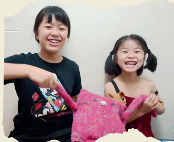
有了它不會再搶我的公仔吧