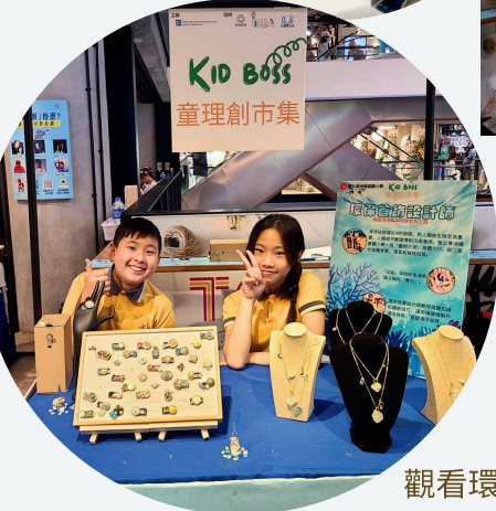
觀看環保首飾活動