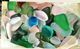
玻璃垃圾經過海水不斷沖擊打磨，可用來製作首飾