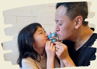
爸爸鼻敏感又想養貓