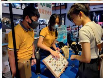
作品獲邀到朗豪坊「童理創市集」展出