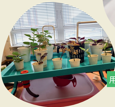
用虹吸式的原理為植物供水