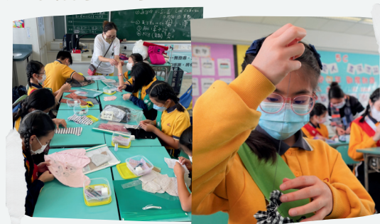
一針一線都不容易