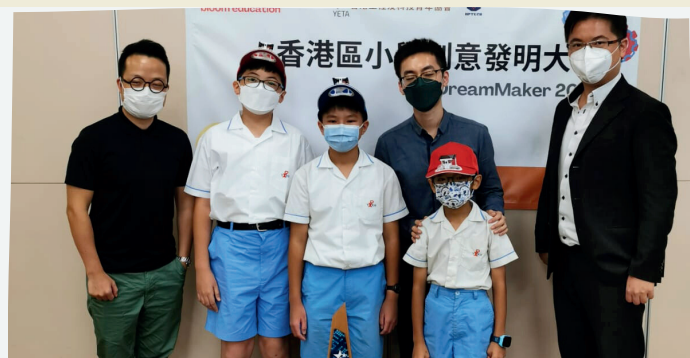
全港發明比賽獲銀獎及最具潛質獎

可掃描QR code 觀看小小發明家在過程中如何排除萬難，到工業區找材料，搜集資料，運用有限資源，達致成功