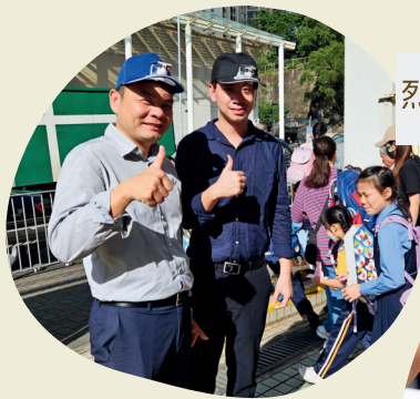
烈日下當值的老師倍感涼快

在此之後，學生繼續觀察別人的需要和痛點，研發出不同的發明品，包括太陽能風扇帽，智能納米自動清潔噴霧，自動花卉灌溉機等。