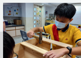
學生一手一腳製作出作品

小小發明家透過創意思維，引導學生觀察身邊人和事，運用同理心，了解別人的需要，再應用日常課堂所學的STEAM知識，研究方案，解決困難。課程由學生主導，自決想研究的課題，再由老師協助。在疫情期間，學生便想出用編程加上SCAMPER的方法，製作出軌跡機械人，沿地上的顏色線移動，為小一的師弟妹運送簿冊，做到無接觸運輸，減低他們感染病毒的機會。