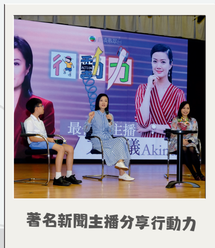
著名新聞主播分享行動力