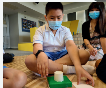
觀看電影 Inside Out後，學習觀察自己情緒，用情緒管理器進行調節