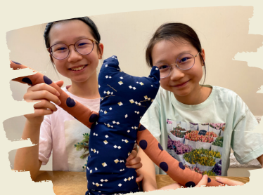
我不在的時候攬著它睡吧