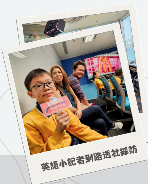
英語小记者到路透社採訪

同時，各級均設多元智能課或課後增潤課，提供豐富的多元智能課程，包括日語、沙畫、網球，無伴奏合唱等超過40個課程，讓學生按能力興趣，浮尖展才。課堂外，學校善用學時，透過不同的多元活動，讓學生參與活動時擴闊眼界，學會如何與他人合作，提升社交能力。同時，各科組按學生的不同才能建立人才庫，提供抽離式的校隊訓練、境內外交流和比賽機會，讓學生透過與世界各地的學生互相砥礪學習。