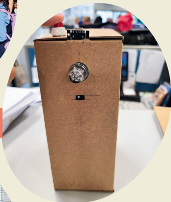
智能納米消毒噴霧