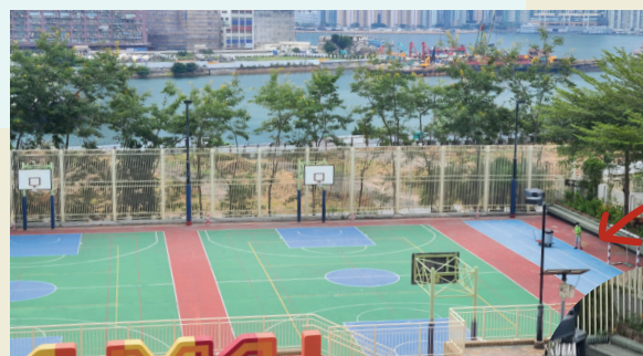
由5樓向下望，有的人會看到偌大的藍球場，或者漂亮的海景

油基期望資優生能運用才能，造就他人。因此，我們近年致力培育學生的同理心，以同理森林、同理深海為主題，培養學生同理心，教導他們為人設想，換位思考，建立與別人的連繫，成為有愛的人。