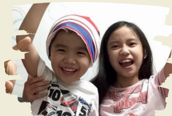
弟弟，這是送你的「新」衣服