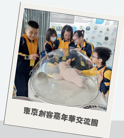
東京創客嘉年華交流團