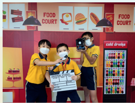
學生拍攝不同短片