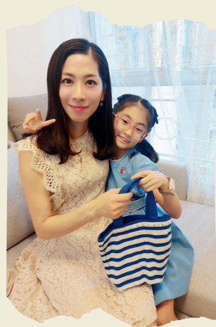
這是媽媽喜愛的顏色