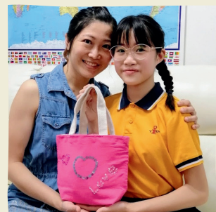
媽媽根本不用太大的手袋，因為她的世界就是我和弟弟，以後我們的書包就是你的手袋了