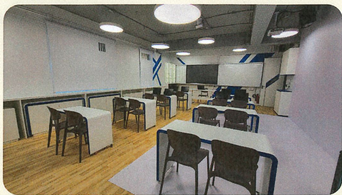
IMMERSIVE LEARNING CENTRE